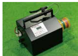
ハンドブレーキ仕様 DS-004PRO/H