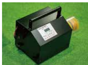
フットブレーキ仕様 DS-004PRO/F